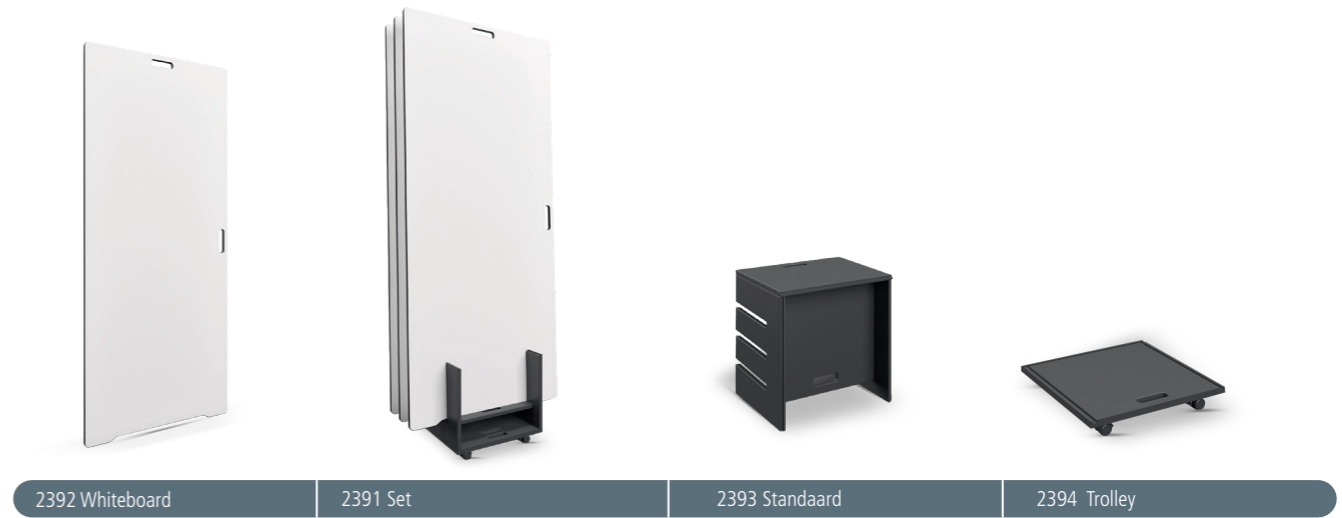
2392 Whiteboard | 2391 Set | 2393 Standaard | 2394 Trolley

De set wordt gecombineerd met een muurbeugel voor verticale of horizontale muurbevestiging van het whiteboard.