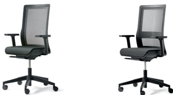
Siège tournant avec accoudoirs réglables en hauteur