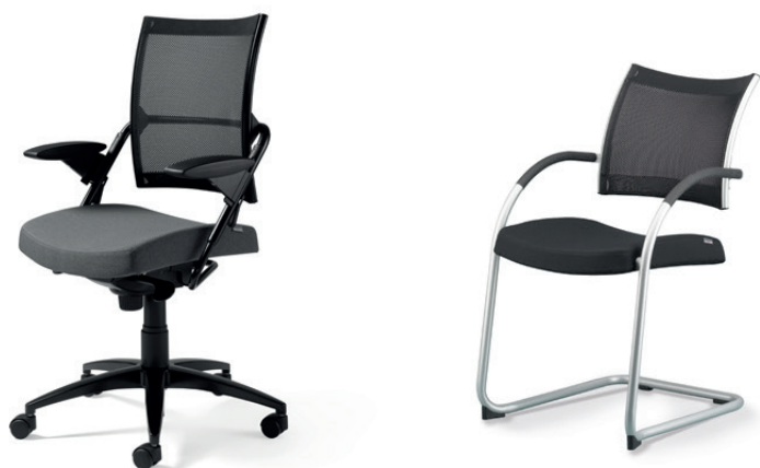
Siège tournant avec accoudoirs réglables en hauteur